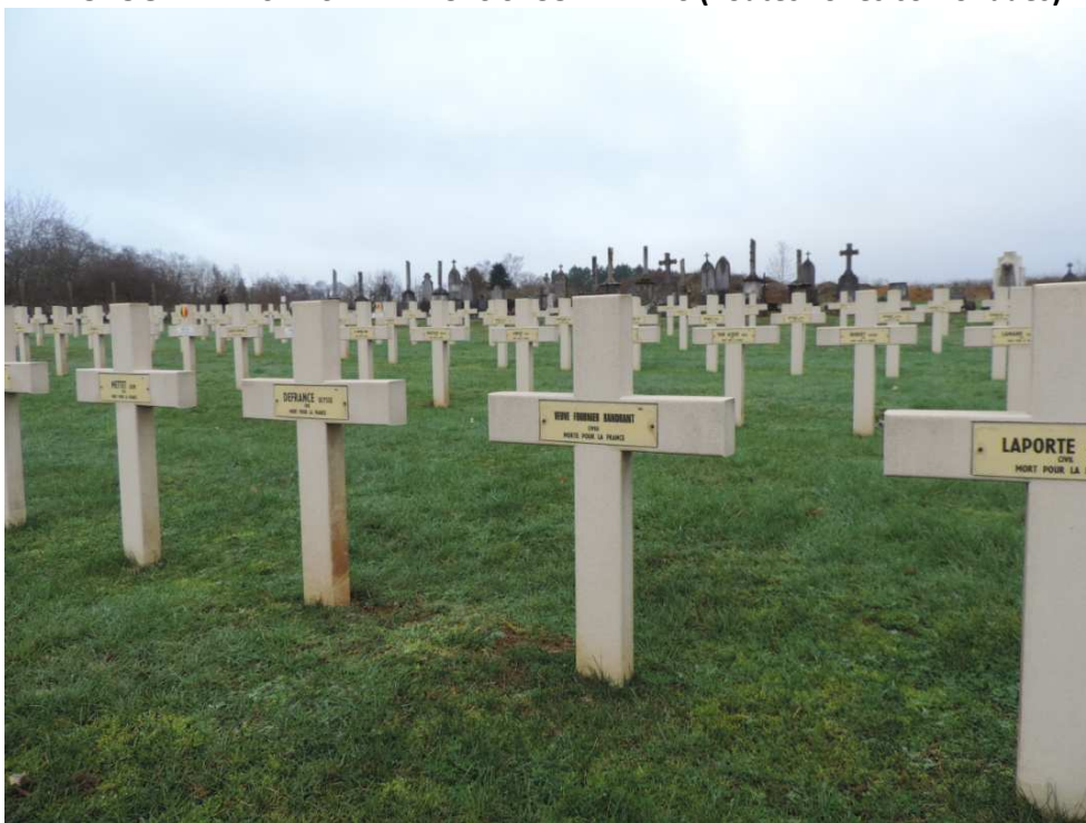
(AR02-b1 Tombes des civils morts au Bagne allemand de Sedan)