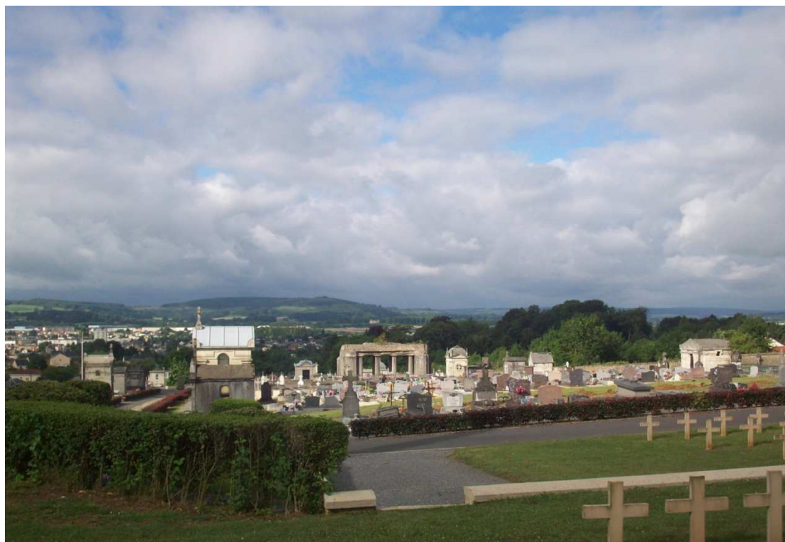
(Monument allemand du cimetière Saint-Charles de Sedan dans son environnement)

Il est composé d'un unique élément constitutif protégé par une zone tampon, qui inclut également le carré militaire qui abrite, mêlées aux tombes militaires, des tombes de civils français et belges décédés au Bagne allemand de Sedan.