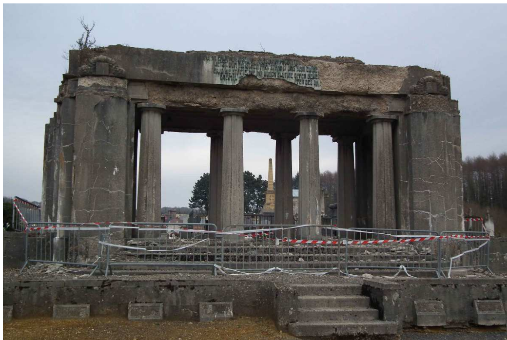
(Monument allemand du cimetière Saint-Charles à Sedan, État actuel, © Conseil départemental des Ardennes, 2014)