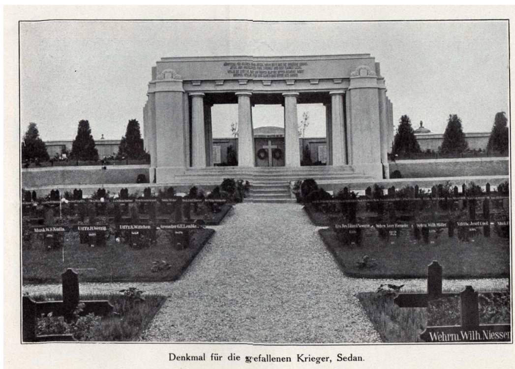
(Monument allemand du cimetière Saint-Charles à Sedan, Carte postale ancienne, S. Haguette / SHAS)