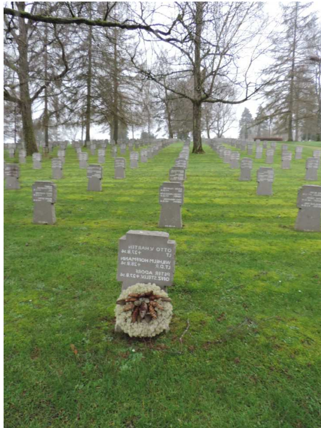
(AR02-i2 Cimetière militaire allemand de Noyers-Pont-Maugis)