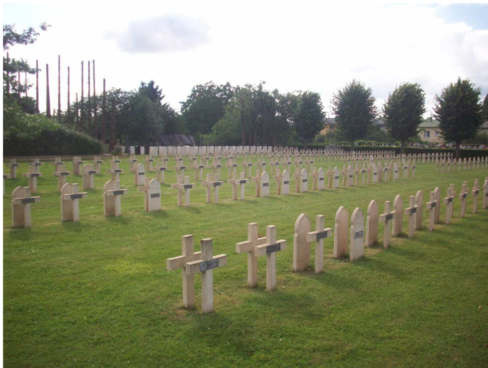
(AR02-i3 Nécropole nationale français de Sedan-Torcy)