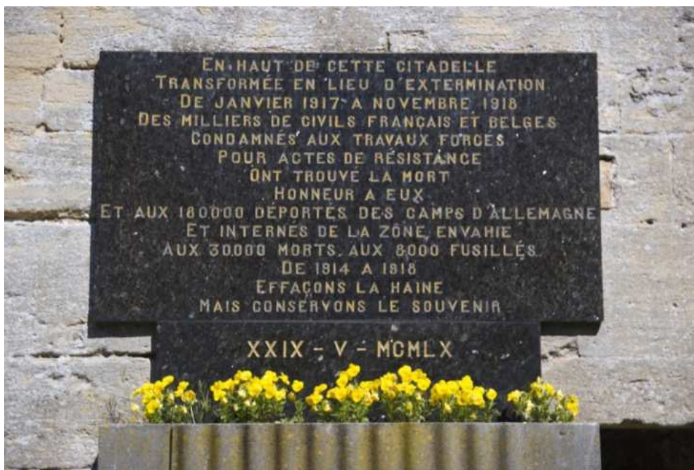
(AR02-i1 Plaque commémorative dans le Bagne / Château-Fort de Sedan,