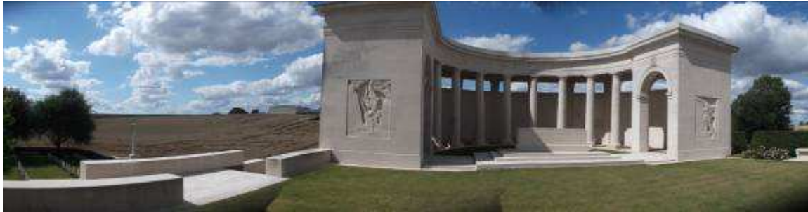
ND03. Cimetière militaire & Mémorial du Commonwealth “Louverval Military Cemetery” & “Cambrai Memorial”, Service Patrimoine, Département du Nord, juillet 2015

Le secteur mémoriel de Louverval est situé dans le sud-ouest du département du Nord, à mi-chemin entre Cambrai et Bapaume. Le site est bordé au Sud par la RD930 qui suit un paysage de plaine vallonnée, et à l’Est par un chemin communal menant au hameau de Louverval. Il est délimité par un muret de pierre de taille couronné de pierre blanche, et entouré de champs.