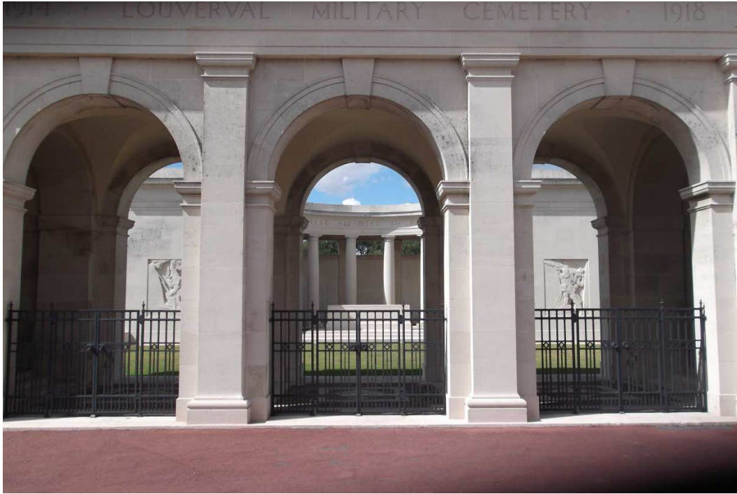
Mémorial du Commonwealth « Cambrai Memorial », Service Patrimoine, Département du Nord, juillet 2015